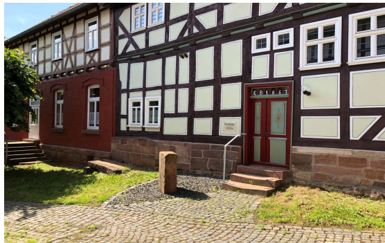
Kulturelles Dorfarchiv, Kirchweg 4

Seinen Traum von der Einrichtung eines Heimatmuseums in den Wohnräumen der ehemaligen Gastwirtschaft „Zur Linde“ konnte er mit der Fertigstellung des „Kulturellen Dorfarchives“ an gleicher Stelle noch miterleben.