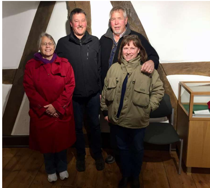
Amerikanischer Besuch im Dorfarchiv

Es hat sich in Bauerbach und darüber hinaus herumgesprochen: Das „Dorfarchiv“ ist sonntags und montags zwischen 15 und 17 Uhr sowie nach Vereinbarung geöffnet. Großes Interesse finden an der Hörstation die Erzählungen eines früheren Messdieners und am Bildschirm eine Auswahl von Kurzfilmen; sie zeigen unter anderem Ausschnitte von alten Dorffesten und Dorfjubiläen mit Bauerbacherinnen und Bauerbachern, die wesentlich jünger aussehen als heute oder leider gar nicht mehr leben. „Kennst´e den?“ oder „Das ist doch die....!“ sind häufige Ausrufe von Besuchern.